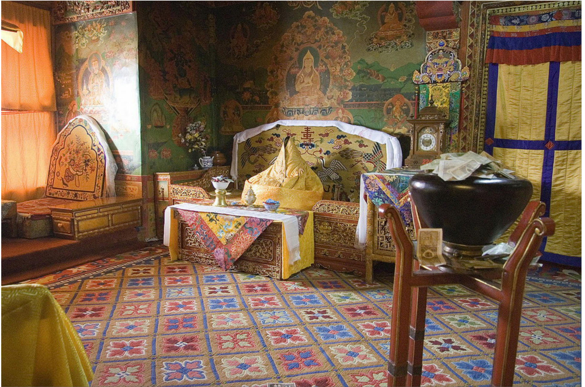
Trên những vách tường của các căn phòng đều có các bích họa với những màu sắc rực rỡ. Trong ảnh là căn phòng dành cho các đời Đạt Lai Lạt Ma sinh sống.