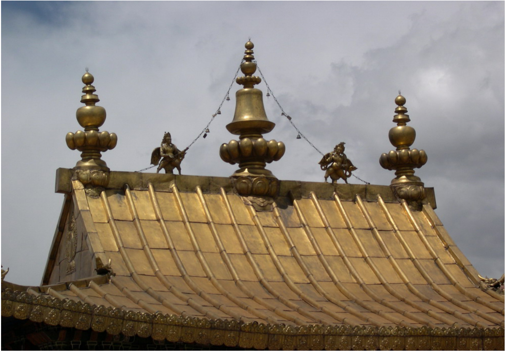
Có tháp phải dùng đến 9 vạn lượng vàng.