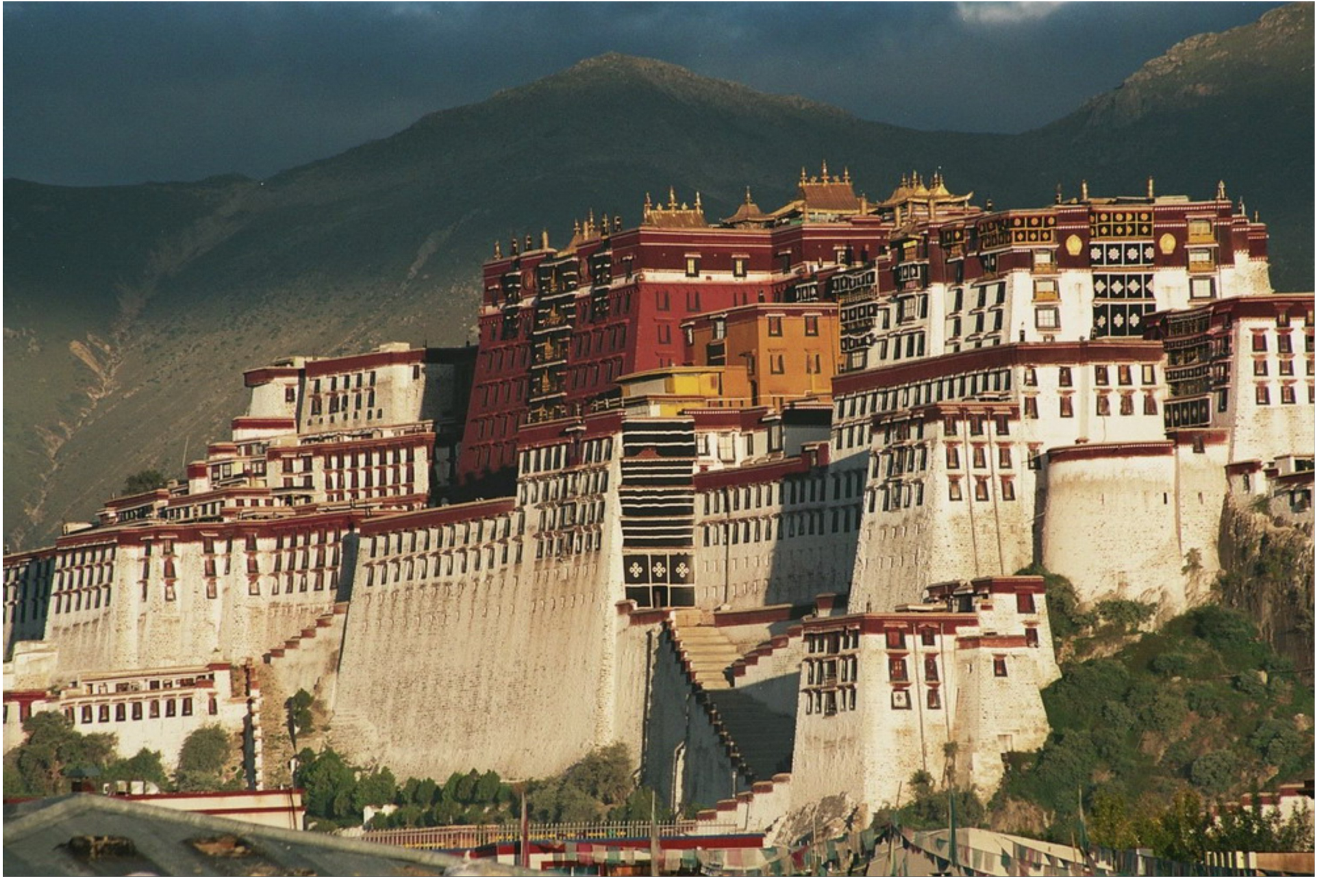
Potala tọa lạc trên đồi Marpori cao 91m so với mặt bằng thành phố. Đây là ngọn đồi được tin là tượng trưng cho Quán Thế Âm Bồ Tát (Avalokiteshvara), là 1 trong 3 ngọn đồi thiêng của thủ đô Lhasa.