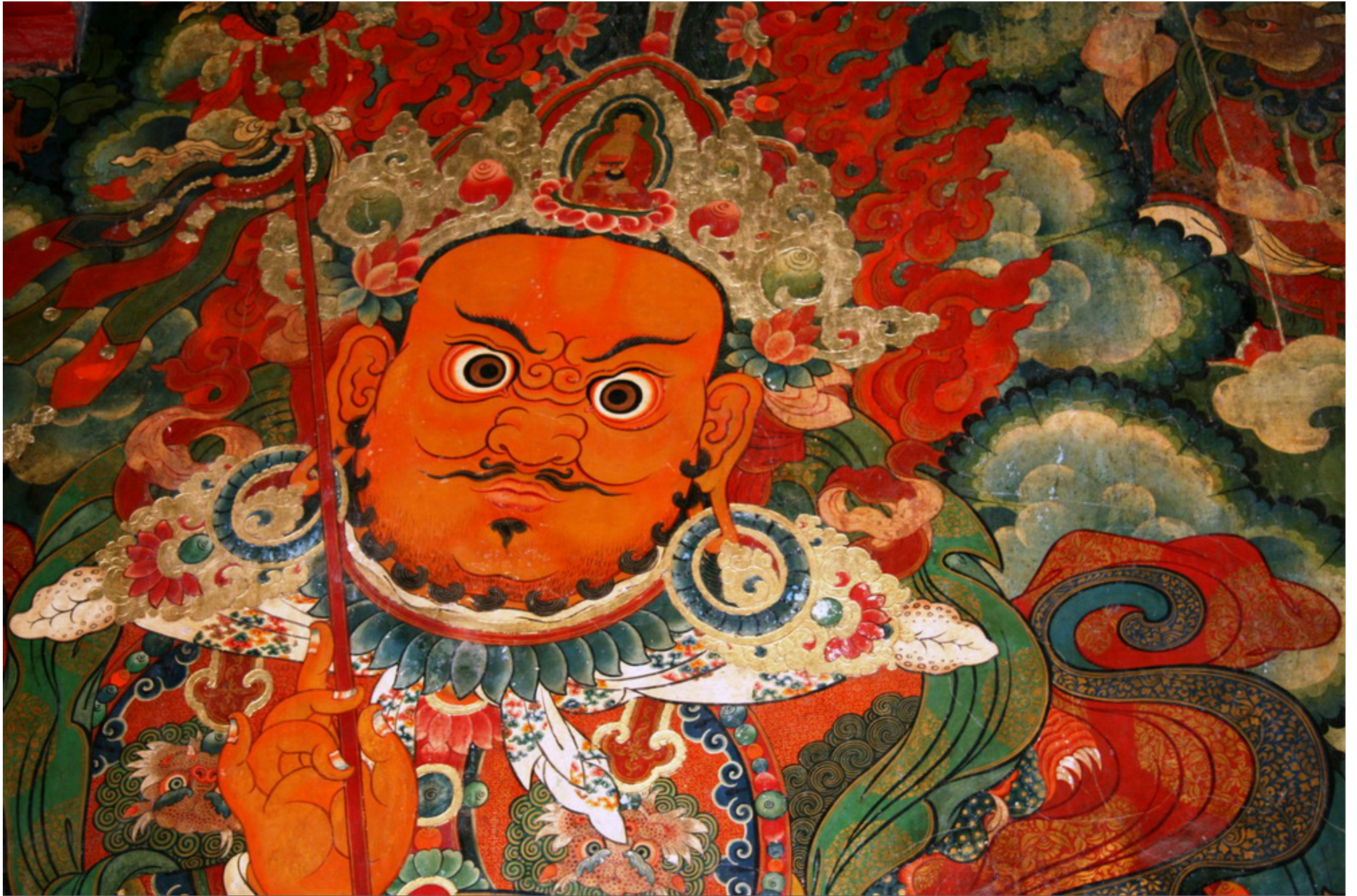
Hai bên cổng là tranh vẽ Tứ Đại Thiên Vương, được xem là tứ tướng hộ pháp của Phật giáo Mật tông – tôn giáo truyền thống của người Tây Tạng. Đây là những kiệt tác vô gia của nghệ thuật Tây Tạng: