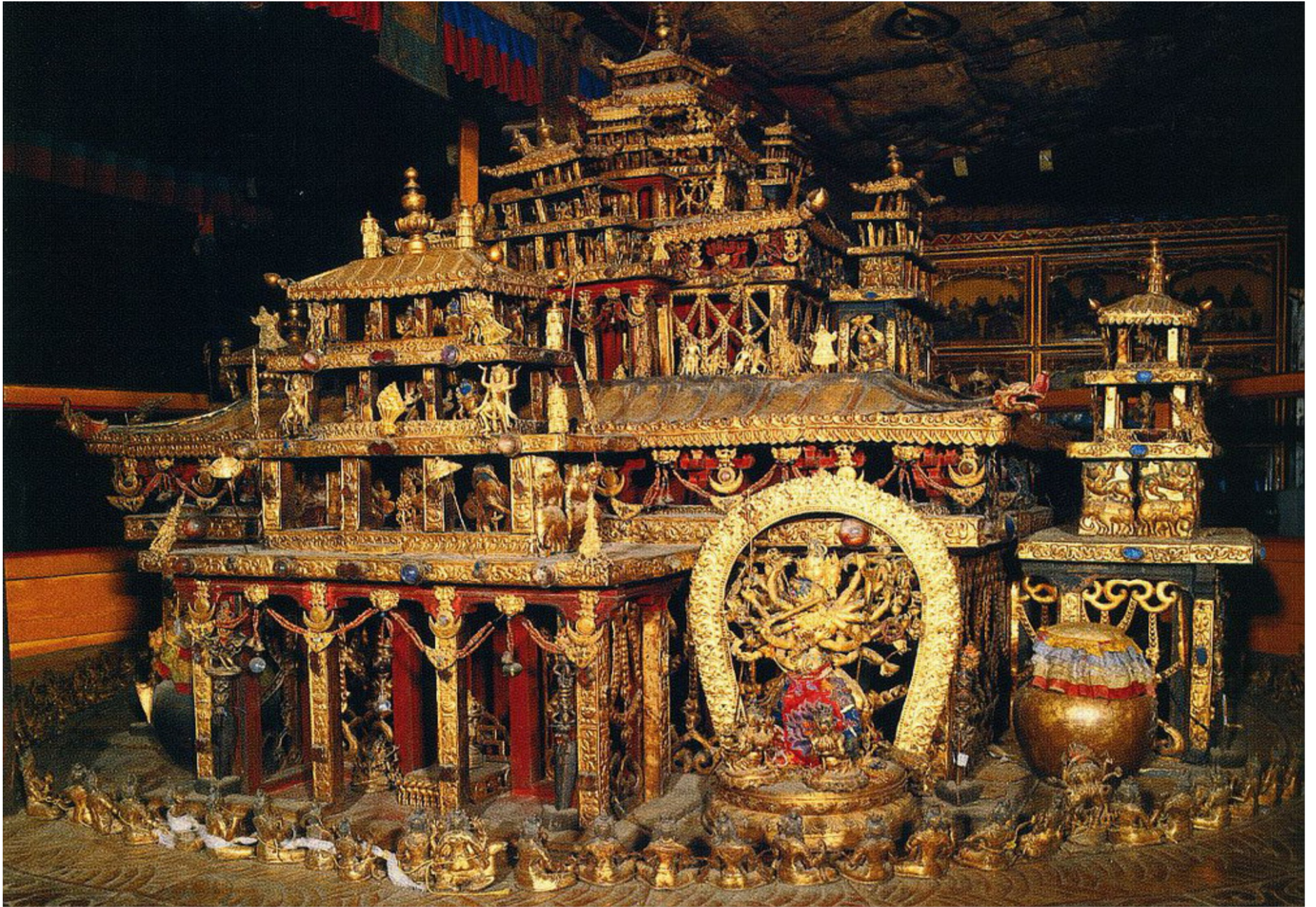
Trong cung điện Potala còn lưu giữ những Mandala (đàn tràng) bằng đồng được đúc vô cùng tinh xảo cách đây hàng trăm năm. Trong ảnh là một Mandala được điêu khắc trên 170 bức tượng.