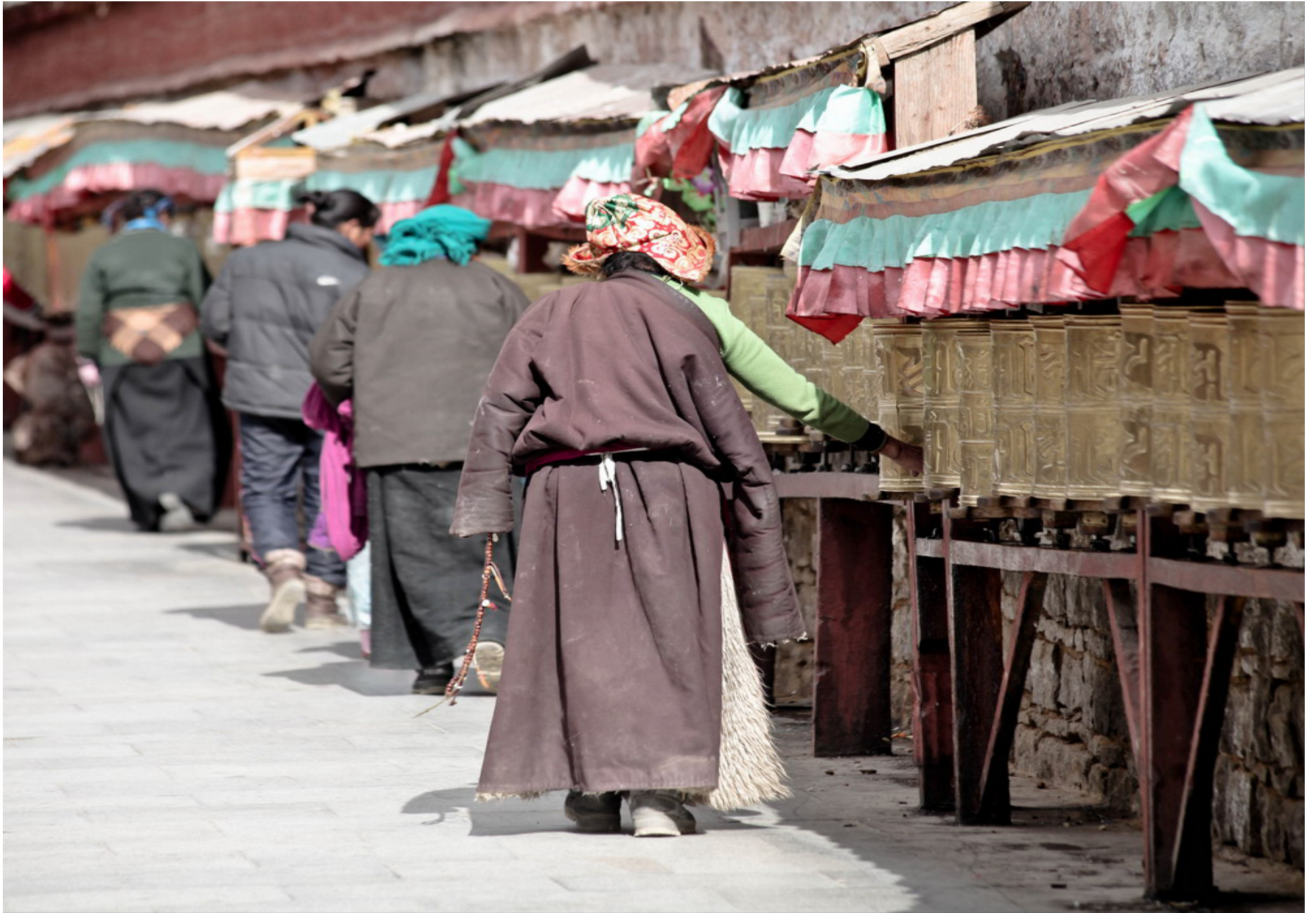
Ven tường bao ngoài dưới chân cung điện là Kora, một con đường với hàng trăm chiếc kinh luân (bánh xe Phật pháp) màu đồng in nổi câu kinh Om Mani Padme Hum xếp dọc theo tường. Những đoàn người Tạng vừa đi vừa đẩy kinh luân xoay theo chiều kim đồng hồ.