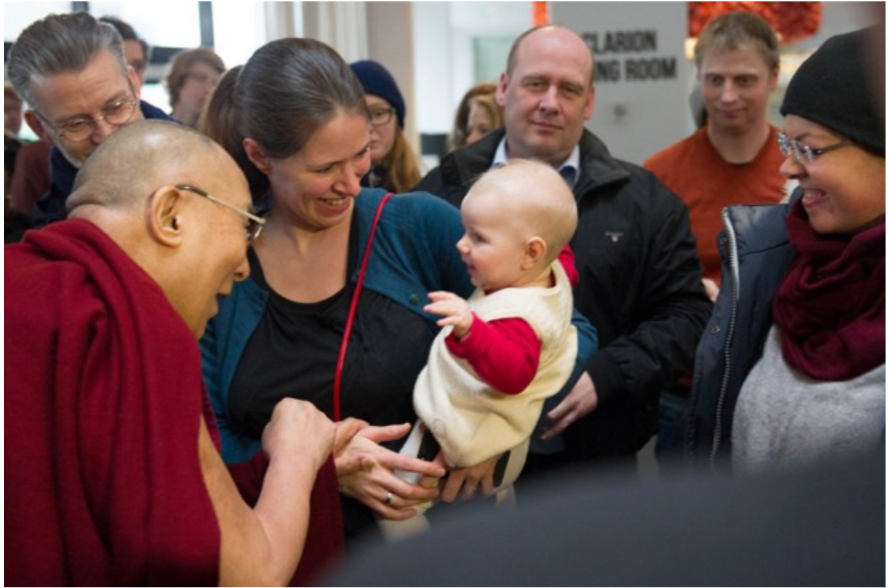
Đức Đạt Lai Lạt Ma chúc Phúc Cát tường cho một bé bi trong lúc vào Trung tâm Hội nghị Clarion, Tp. Trondheim, Na Uy. 09/02/2015.