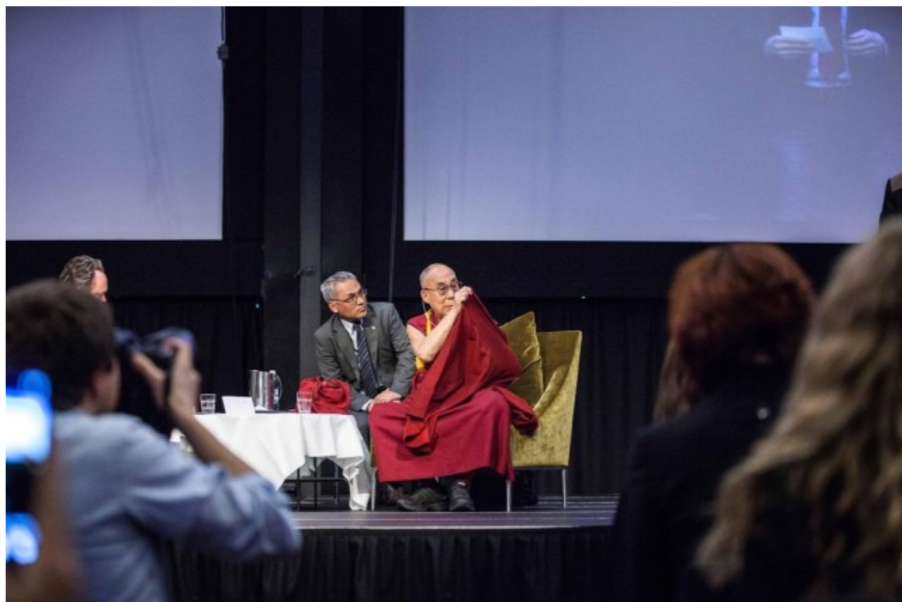
Đức Đạt Lai Lạt Ma đến tham dự (ISFIT) lần thứ hai. Ngài đã có mặt trong Liên hoan Sinh viên Quốc tế Trondheim (ISFIT) năm 1994. 09/02/2015.