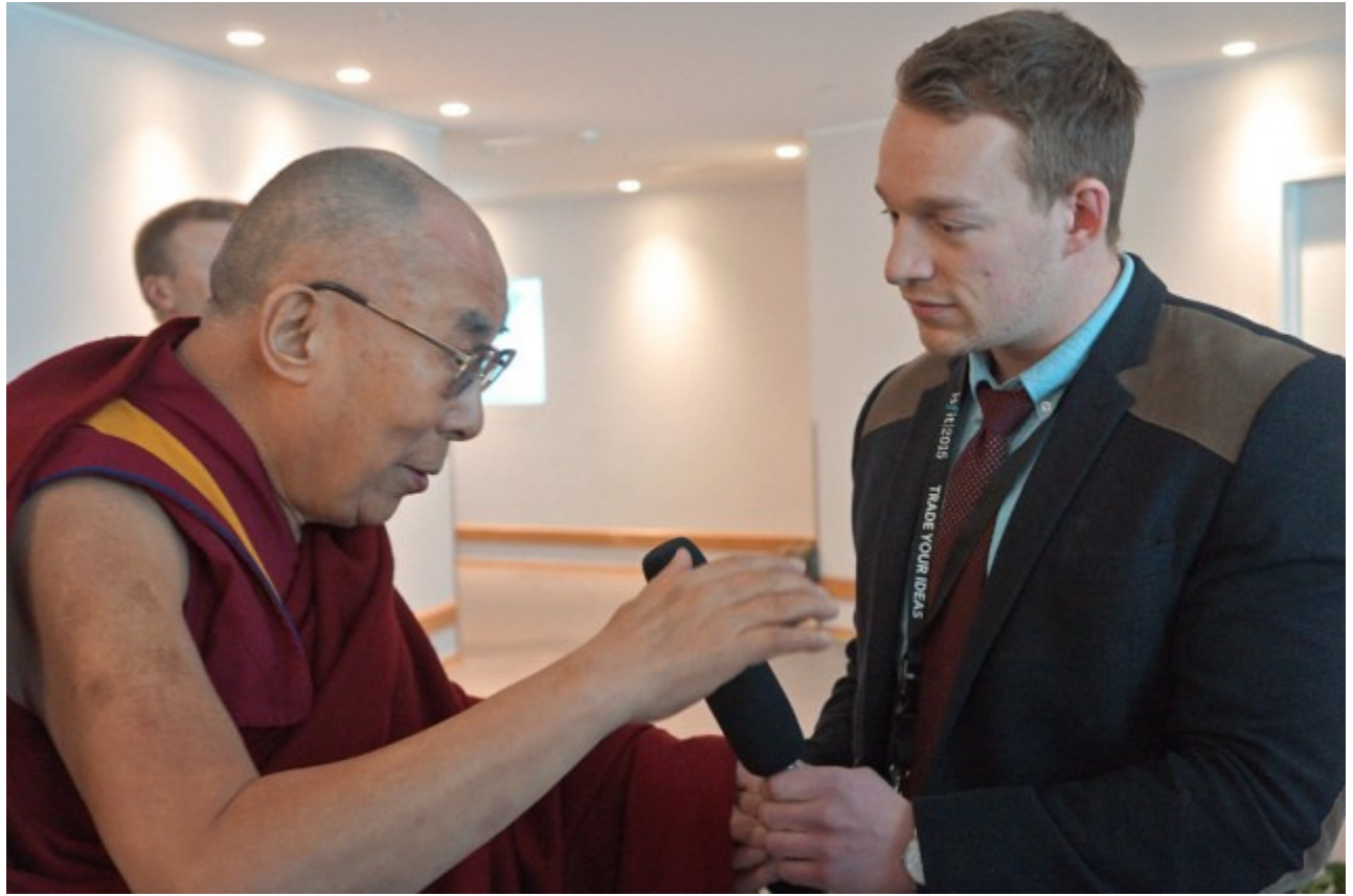
Đức Đạt Lai Lạt Ma trả lời với các phóng viên báo giới tại Trung tâm Hội nghị Clarion, Tp. Trondheim, Na Uy. 09/02/2015.