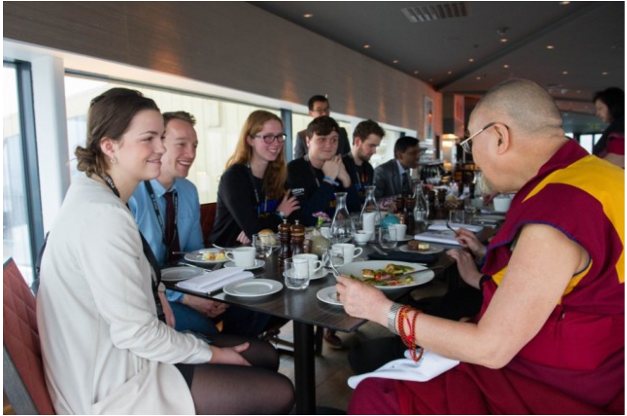
Đức Đạt Lai Lạt Ma cùng ăn trưa với các sinh viên tham dự Festival Sinh viên Quốc tế tại Trondheim (ISFiT), Trung tâm Hội nghị Clarion, Tp. Trondheim, Na Uy. 09/02/2015.