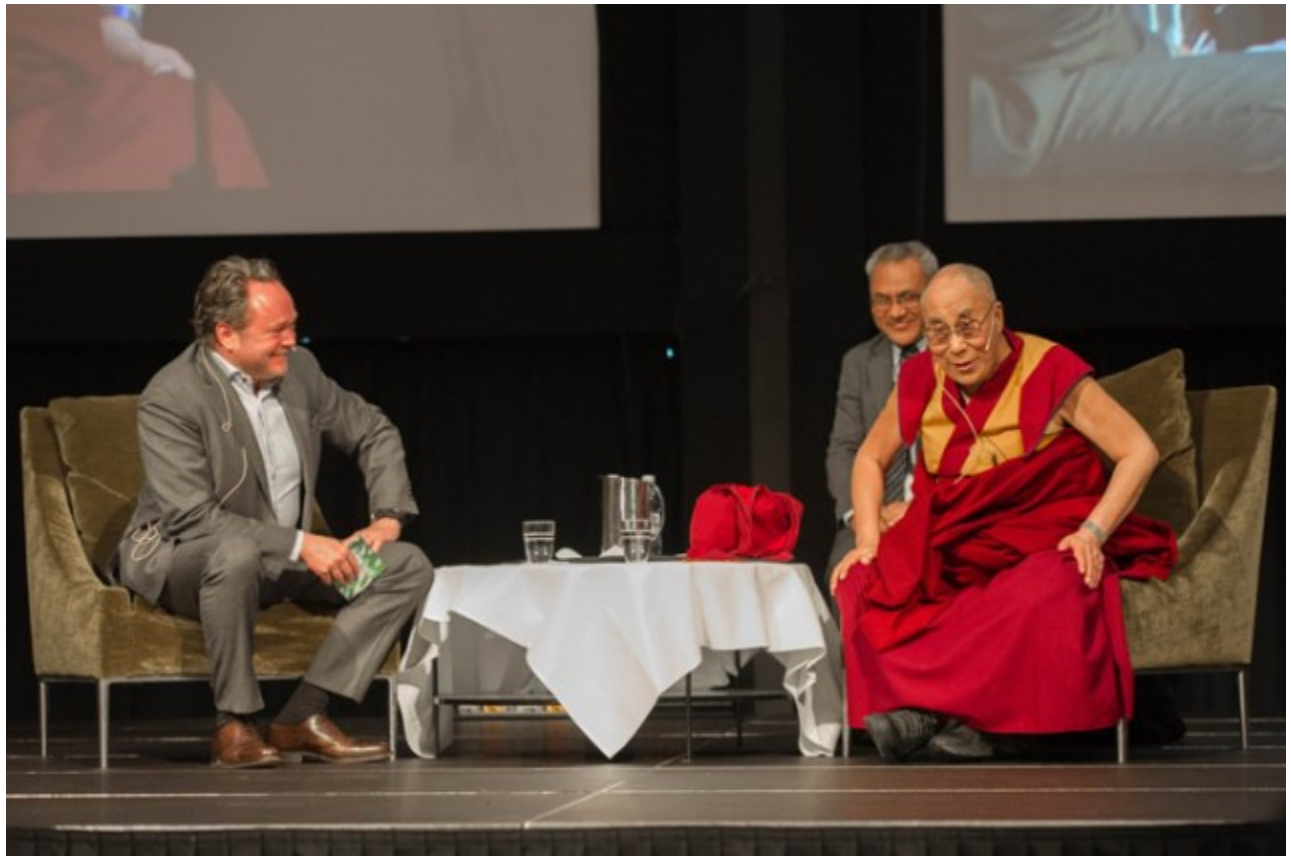
Đức Đạt Lai Lạt Ma khai thị những thắc mắc tại Liên hoan Sinh viên Quốc tế Trondheim (ISFIT), Trung tâm Hội nghị Clarion, Tp. Trondheim, Na Uy. 09/02/2015.