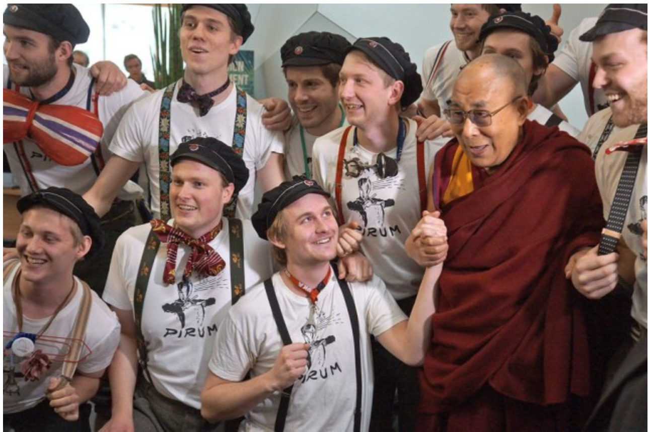
Ban Nhạc nô nước tươi cười cung đón đức Đạt Lai Lạt Ma vào Trung tâm Hội nghị Clarion, tham dự Festival Sinh viên Quốc tế (ISFIT), Tp. Trondheim, Na Uy. 09/02/2015.